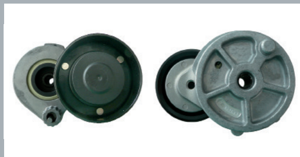
Рис. 1: Старая модификация 58883

На переходном этапе возможно наличие смешанных складских запасов обоих типов.